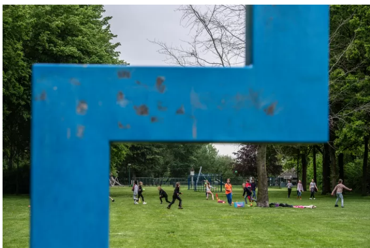
▲ De groene long van Bavel, langs het Kerkenpad. Het ruime grasveld wordt onder meer door basisscholen gebruikt om buiten te kunnen sporten.

In de verte doemt korenmolen De Hoop op. De locatie die Bavel verbindt. De fietsbrug over de A27 vanuit Nieuw Wolfslaar sluit bijna naadloos aan op het terras en vanuit de oude dorpskern is 5 tot 10 minuten wandelen. Sinds de nieuwe eigenaren in de molen zitten, is het nog meer een ontmoetingsplek voor jong en oud geworden, met een terras, wat speeltoestellen en een dierenweide.